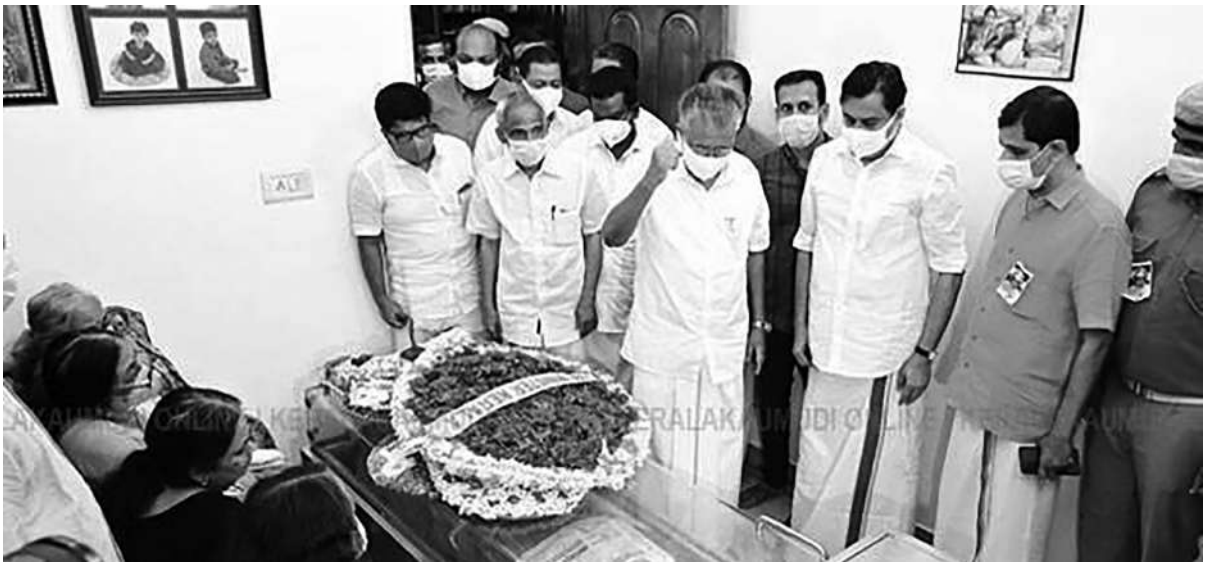
മുൻ ധനകാര്യമന്ത്രിയും സി.പി.എം. സംസ്ഥാന സെക്രട്ടേറിയറ്റ് അംഗവുമായിരുന്ന ടി. ശിവദാസ മേനോൻ മുഖ്യ മന്ത്രി അന്ത്യോദിവാദ്യം അർപ്പിക്കുന്നു.