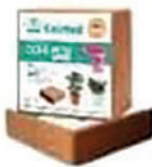
Coir Pith Briquette