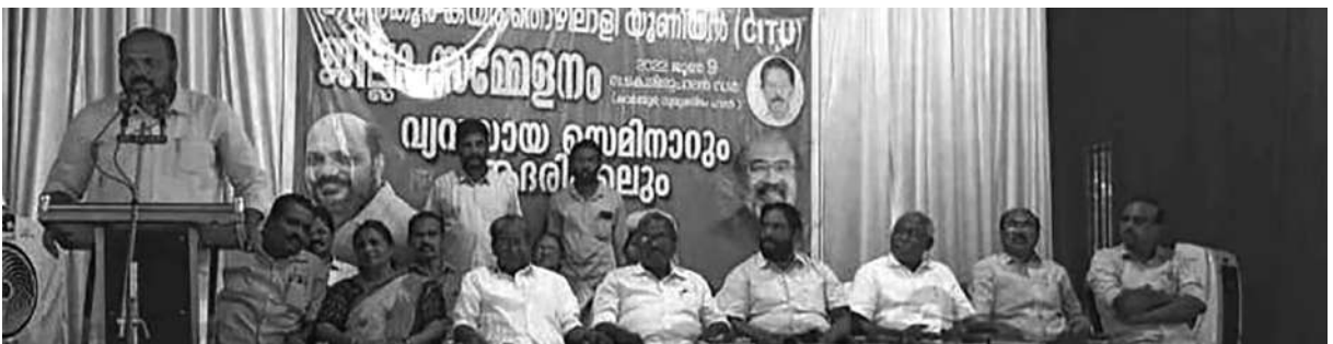
ട്രാവൻകൂർ കയർ തൊഴിലാളി യൂണിയൻ (സി.ഐ.ടി.യു.) 48-ാമത് വാർഷിക സമ്മേളനത്തോടനുബന്ധിച്ച് തിരുവനന്തപുരം കവലയൂർ ഗുരുമന്ദിരം ഹാളിൽ നടന്ന വ്യവസായ സെമിനാറും വിവിധമേഖലകളിലുള്ളവരെ ആദരിക്കലും വ്യവസായ നിയമ കയർ മന്ത്രി പി. രാജീവ് ഉദ്ഘാടനം ചെയ്യുന്നു.

കയർ വ്യവസായ പുരോഗതിക്കായി അടിസ്ഥാനപരമായ മാറ്റം അനിവാര്യമാണെന്ന് സംസ്ഥാന വ്യവസായ നിയമ കയർ മന്ത്രി പി. രാജീവ് പ്രസ്താവിച്ചു. ട്രാവൻകൂർ കയർ തൊഴിലാളി യൂണിയൻ (സി.ഐ.ടി.യു.) 48-ാമത് വാർഷിക സമ്മേളനത്തോടനുബന്ധിച്ച് തിരുവനന്തപുരം കവലയൂർ ഗുരുമന്ദിരം ഹാളിൽ നടന്ന വ്യവസായ സെമിനാറും വിവിധമേഖലകളിലുള്ളവരെ ആദരിക്കലും ഉദ്ഘാടനം ചെയ്യുകയായിരുന്നു മന്ത്രി.