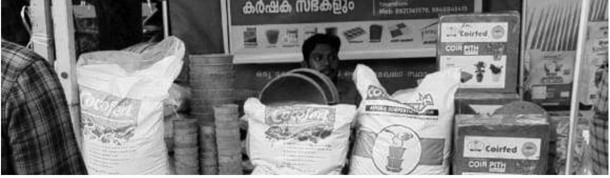
കേരള സംസ്ഥാന കൃഷി വകുപ്പ് തിരുവനന്തപുരം കൂടപ്പനക്കുന്നിൽ സംഘടിപ്പിച്ച ഞാറ്റുവേലചന്തയും കർഷക സഭകളും എന്ന പരിപാടിയിൽ കയർഫെഡിന്റെ സ്റ്റാൾ