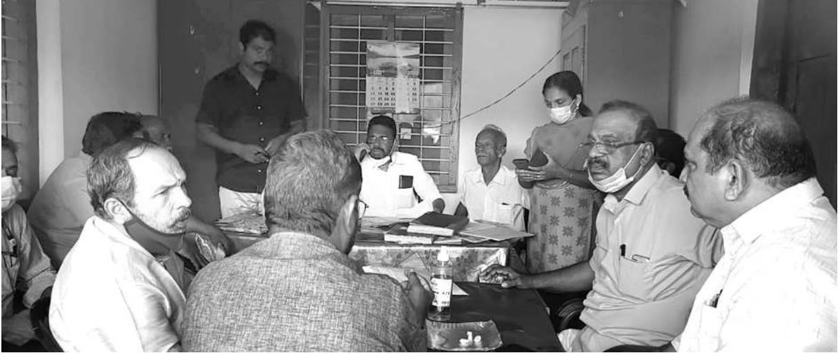
കയർ വില പുനർനിർണ്ണയിക്കുന്നതിന് സർക്കാർ നിയോഗിച്ച സമിതി കായംകുളം പ്രോജക്റ്റിലെ കയർ സംഘങ്ങൾ സന്ദർശിക്കുന്നു

സർക്കാർ നിയോഗിച്ച 2019 ലെ സമിതി റിപ്പോർട്ടിന്റെ അടിസ്ഥാനത്തിൽ സർക്കാർ അംഗീകരിച്ച കയർ വിലയാണ് നിലവിൽ നൽകിക്കൊണ്ടിരിക്കുന്നത്. കയർ വില പുനർനിർണ്ണയിക്കുന്നതിന് ശക്തമായ ആവശ്യം ഉയർന്നതിന്റെ അടിസ്ഥാനത്തിൽ അപ്പക്സ് ബോഡി ഫോർ കയറിന്റെ തീരുമാനപ്രകാരം കയർ വില പുനർ നിർണ്ണയിക്കുന്നതിന് ഒരു സമിതി രൂപീകരിക്കുന്നതിന് കയർ വികസന ഡയറക്ടർ സർക്കാരിനോട് ശുപാർശ ചെയ്തിരുന്നു.