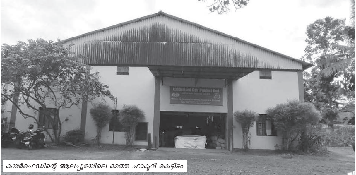
കയർഫെഡിന്റെ ആലപ്പുഴയിലെ മെത്ത ഫാക്ടറി കെട്ടിടം